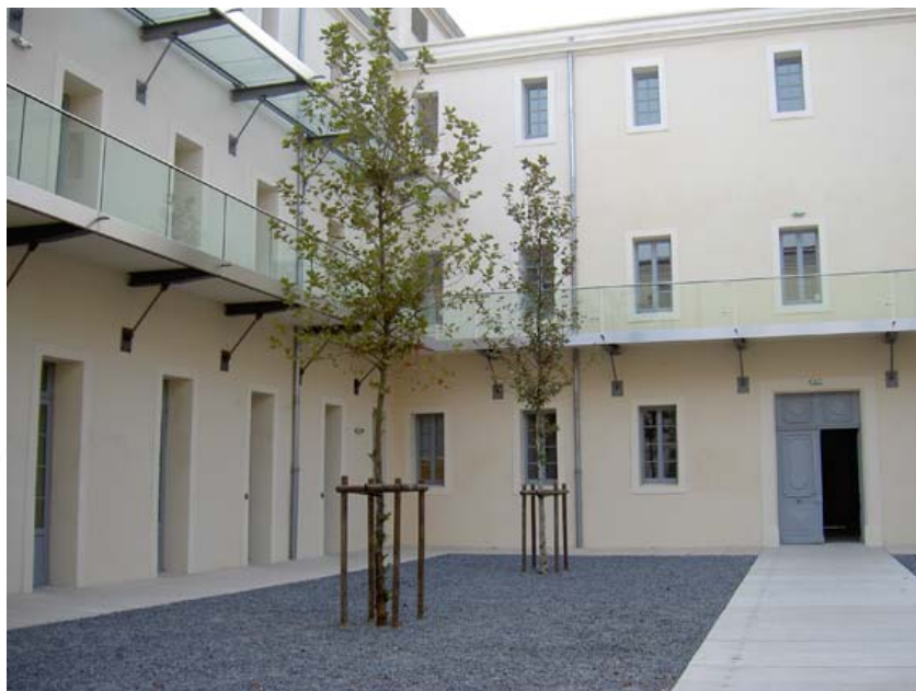
La cour des platanes