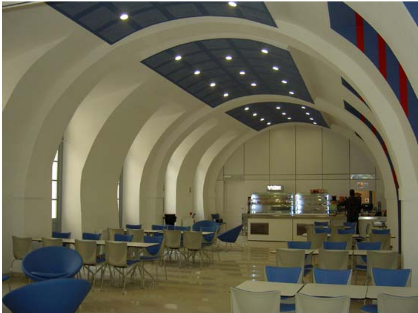
Au rez-de-chaussée, une cafétéria.