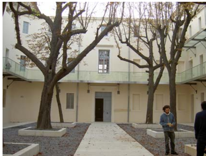
La cour des marronniers