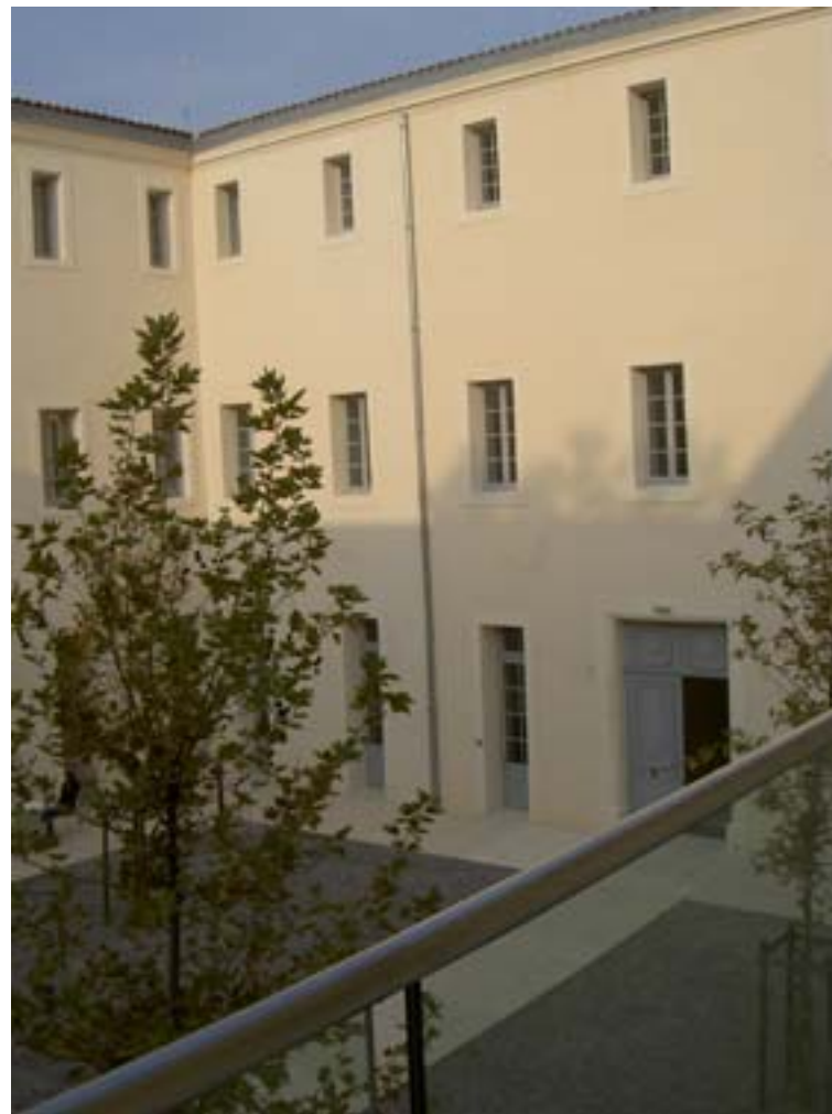
D'autres salles de l'IRCL donnent sur la cour intérieure des platanes.