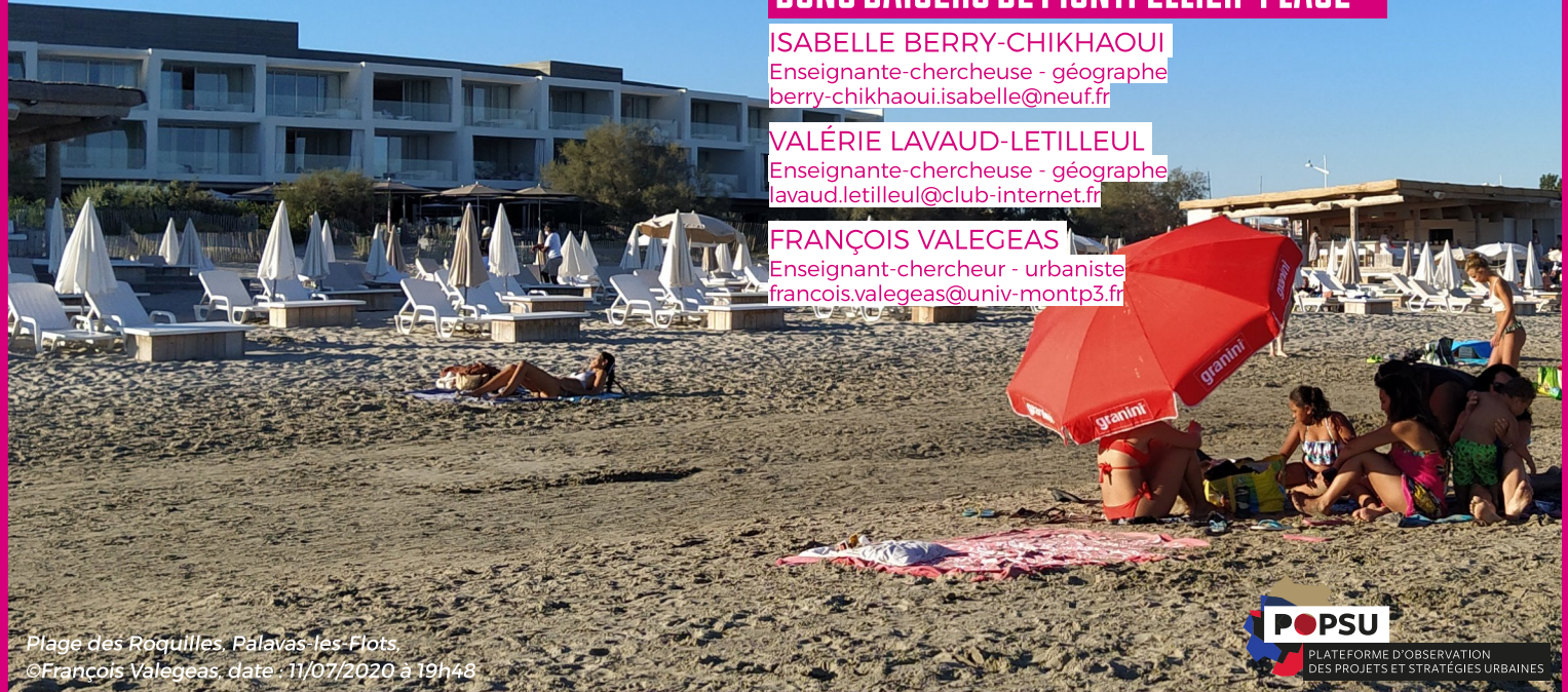
Plage des Roquilles, Palavas-les-Flots. date : 11/07/2020 à 19h48

FRANÇOIS VALEGEAS Enseignant-chercheur - urbaniste francois.valegeas@univ-montp3.fr